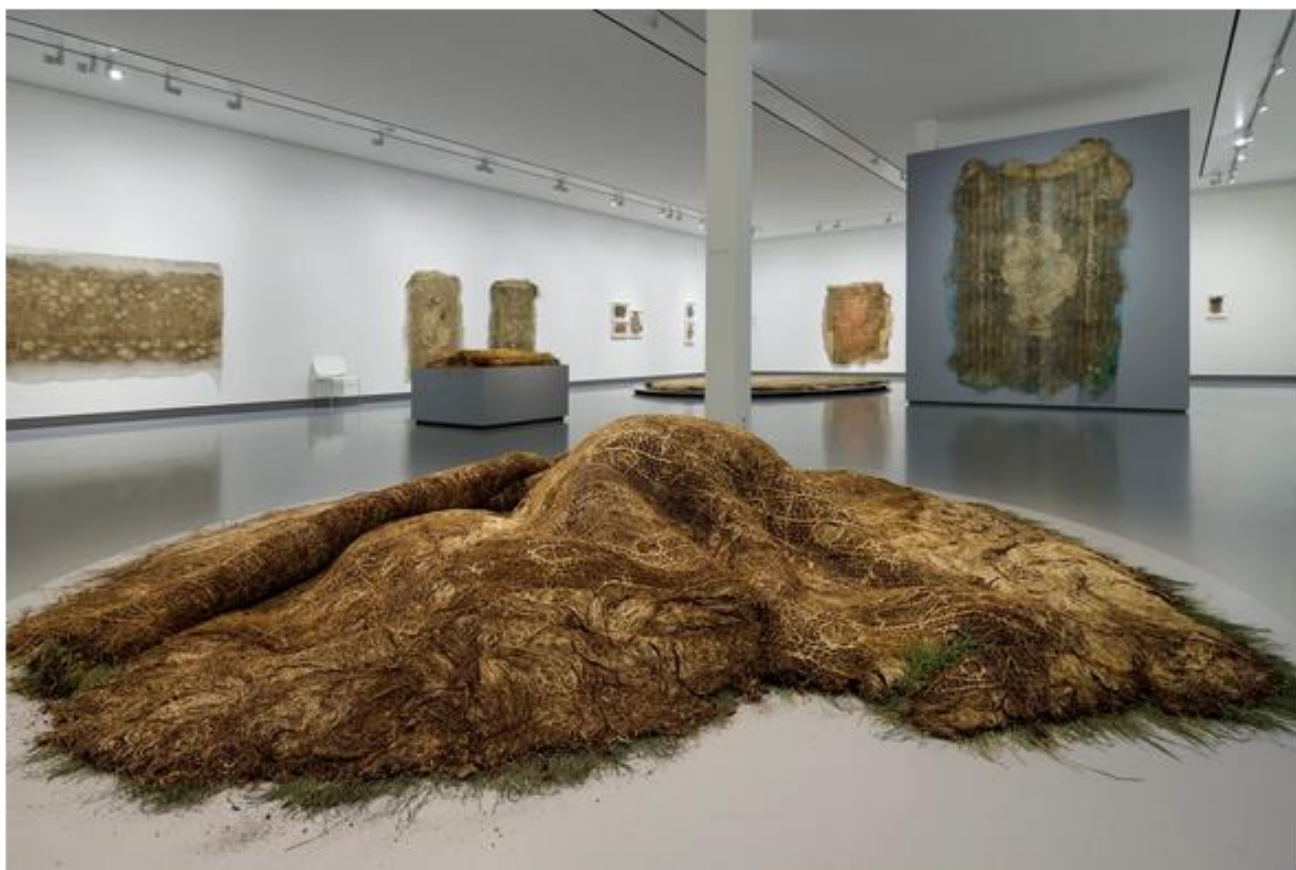
De expositie 'Diana Scherer – Farming Textiles' in Museum Kranenburgh in Bergen.